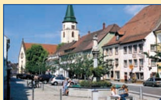
Informations- und Kulturamt 78183 Hüfingen • Hauptstr. 16–18 Tel. 0771/60 09-24 • www.huefingen.de