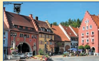
Hochschwarzwald Tourismus GmbH 79843 Löffingen • Rathausplatz 14 Tel. 07652/1206-83 50 • www.hochschwarzwald.de