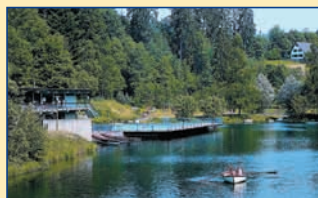
Hochschwarzwald Tourismus GmbH 79877 Friedenweiler • Peter-Thumb-Str. 16 Tel. 07652/12 06-83 60 • www.hochschwarzwald.de