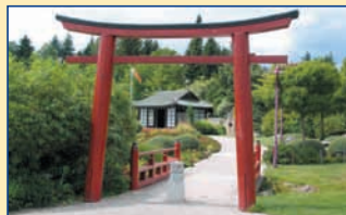
Tourist-Information • 79848 Bonndorf Martinstr. 5 • Tel. 07703/76 07 www.bonndorf.de