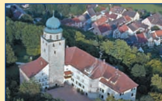
Tourist-Information • 79780 Stühlingen Schlossstraße 9 • Tel. 07744 / 532 34 www.stuehlingen.de/tourismus