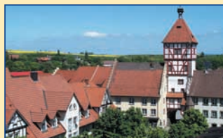
Tourist-Information • 78199 Bräunlingen Kirchstr. 3 • Tel. 0771/619 00 www.braeueningen.de