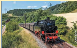
Tourist-Information • 78176 Blumberg Hauptstr. 52 • Tel. 07702/512 00 www.stadt-blumberg.de