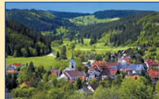
Hochschwarzwald Tourismus GmbH 79853 Lenzkirch • Am Kurpark 2 Tel. 07652/12 06-84 00 • www.hochschwarzwald.de

500–900 m ü. NN; 7800 Einw.; Erholungs-ort; Sehenswürdigkeiten: historische und denkmalgeschützte Altstadt, Stadtmuseum für Kunst & Geschichte, Schulmuseum, Römische Badruine, Aquari- Familienfreizeitbad mit Saunalandschaft, Wandern und Radfahren, Wandern in der Gauchachschlucht, Nordic Walking, Orchideenlehrpfad, Wald- und Kräuterlehrpfad, verschiedene Waldlehrpfade.