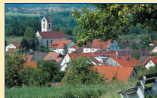
Tourist-Information • 79879 Wutach Amtshausstr. 2 • Tel. 07709 / 929 69-0 www.wutach.de